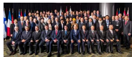
第3回パリMOU・東京MOU合同関係会議 （2017年5月 於：バンクーバー）

世界各地域のMOUとの連携を図るため、パリMOU、黒海MOU、インド洋MOUなどとPSC検査データベースの共有化、共通のテーマでのCICの実施などを行っています。また、パリMOUとの間では、それぞれのPSC委員会にオブザーバーとして参加し情報の共有、連携を図っています。また、パリMOUとは、両MOU加盟当局等のPSC担当関係会合を、これまで3回開催し、両MOUを中心にグローバルなPSCの推進のための行動指針（関係宣言）を採択しています。