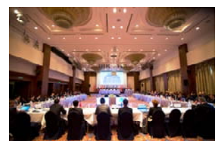
第28回PSC委員会 (2017年、ウラジオストック)

東京MOUでは、 PSC委員会 (メンバー当局、協力メンバー当局、オブザーバーで構成)を年1回以上開催し、メンバー当局が実施したPSCの実績を踏まえながら、PSC検査手順、通報・連絡体制、新たな条約や要件に関するPSC実施方法、検査船舶の選定基準、データベースシステムの運用状況、PSC検査官の能力向上のための研修、他の地域PSC協力組織との協調方策などについて審議し、決議します。