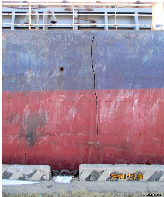
2016年表彰写真：2016年1月28日 ロシア・ナホトカ港 (一般/多目的貨物船:荒海航海による船側外板の亀裂)