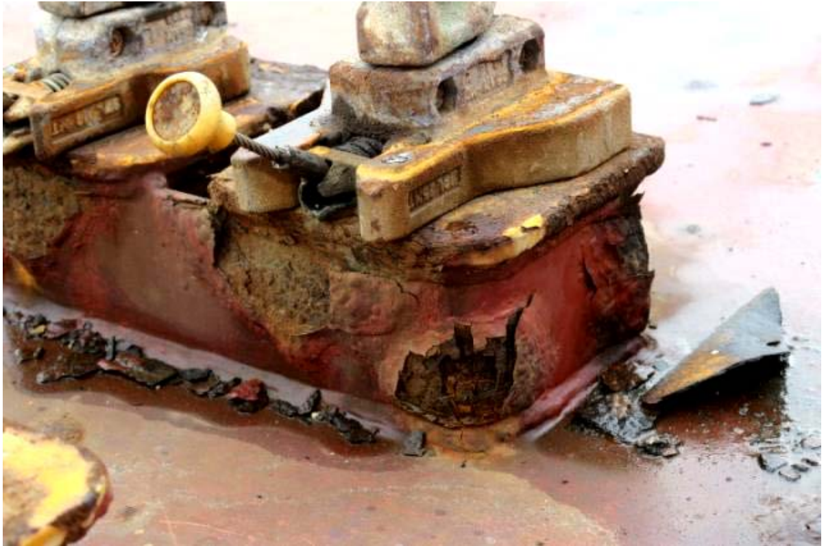
2018年表彰写真：2018年5月27日 中国・上海港（コンテナ船:固縛装置の過度な損耗）