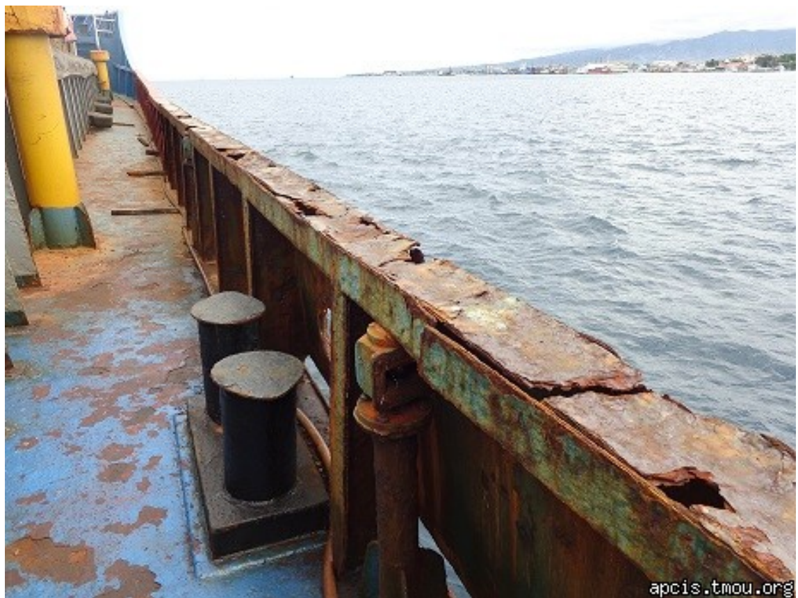
2013年表彰写真：2013年7月9日 フィリピン・サンボアンガ港 (ばら積み船:放水口の過度な腐食・劣化)