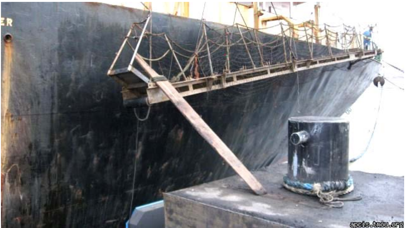
2009 年表彰写真：2009 年 10 月 22 日 ロシア・ヴァニノ港（ばら積み船:乗降用梯子の欠陥）

ここに纏めたのは、“Deficiency Photo of the Year”表彰制度創設以降、表彰された「劣悪サブスタンダード船」の不適合事例の写真です。アジア太平洋地域では、まだまだこのような船舶が横行しており、東京MOUは、これら船舶の撲滅に向け、精力的に活動を行っています。