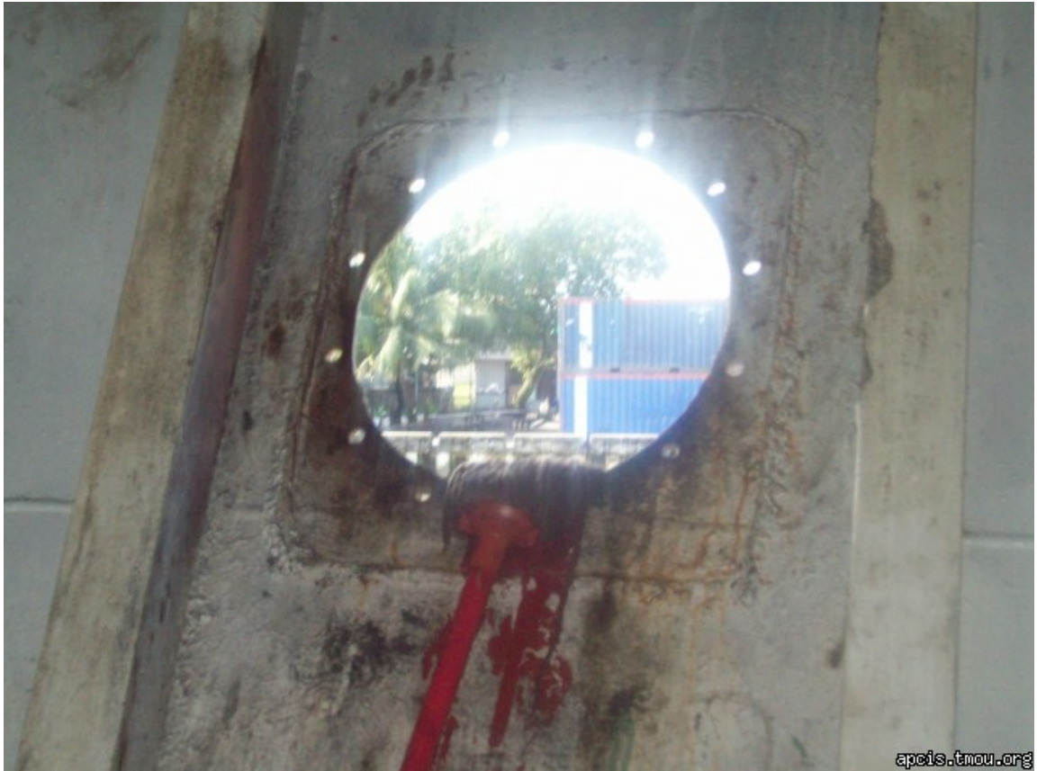
2010年表彰写真：2010年6月29日 パプアニューギニア・ラエ港（タンカー:舷窓（水密窓）の欠陥）