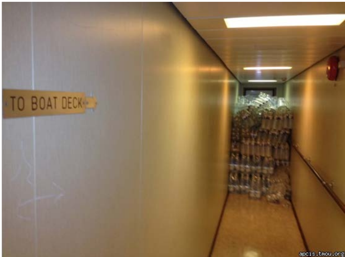
2012年表彰写真：2012年6月28日 チリ・サンアントニオ港 (コンテナ船:避難経路に関する欠陥—通行不能)