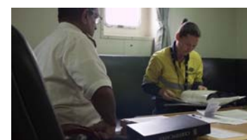
初期検査

船体の外観、船内の状況を観察しながら乗船し、船長から積み荷や航海の状況などを聴取します。あわせて証書、記録類、船員の資格証明書等国際条約で要求される書類をチェックし、船内を巡視します。