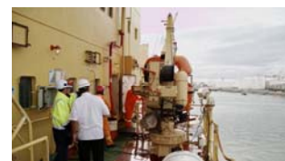
PSCの様子 （豪州海事庁ウェブサイトより）

「PSC」とは、Port State Control（ポートステートコントロール：外国船舶の監督）の略で、国際条約 ※1 において寄港国政府職員が実施することを認められている入港外国船舶に対する立入検査（船舶の構造・安全設備、海洋汚染防止設備、船員の資格や生活労働環境などが国際条約の要件に適合しているかを確認する検査）のことです。