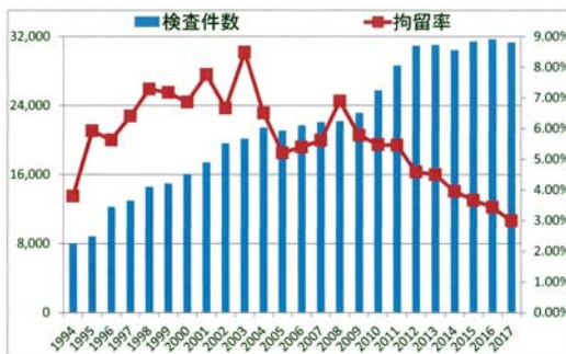
東京MOUのPSC検査件数・拘留率の推移

また、東京MOUでは、毎年5月上旬に前年の活動をまとめた年次報告書（Annual Report：英文のみ）を英文ウェブサイトに公表（ホームページの“Publications”のタブをクリック）しています。Annual Report では、その年の東京MOUの活動内容に加えメンバー当局が行った P S C 検査実績を集計、分析した図表も掲載しています。