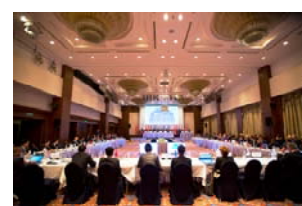
第28回PSC委員会 (2017年、ウラジオストック)

東京MOUでは、 PSC委員会 (メンバー当局、協力メンバー当局、オブザーバーで構成)を年1回以上開催し、メンバー当局が実施したPSCの実績を踏まえながら、PSC検査手順、通報・連絡体制、新たな条約や要件に関するPSC実施方法、検査船舶の選定基準、データベースシステムの運用状況、PSC検査官の能力向上のための研修、他の地域PSC協力組織との協調方策などについて審議し、決議します。