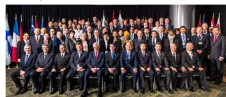
第3回パリMOU・東京MOU合同閣僚会議 (2017年5月 於:バンクーバー)

世界各地域のMOUとの連携を図るため、パリMOU、黒海MOU、インド洋MOUなどとPSC検査データベースの共有化、共通のテーマでのCICの実施などを行っています。また、パリMOUとの間では、それぞれのPSC委員会にオブザーバーとして参加し情報の共有、連携を図っています。また、パリMOUとは、両MOU加盟当局等のPSC担当閣僚会合を、これまで3回開催し、両MOUを中心にグローバルなPSCの推進のための行動指針(閣僚宣言)を採択しています。